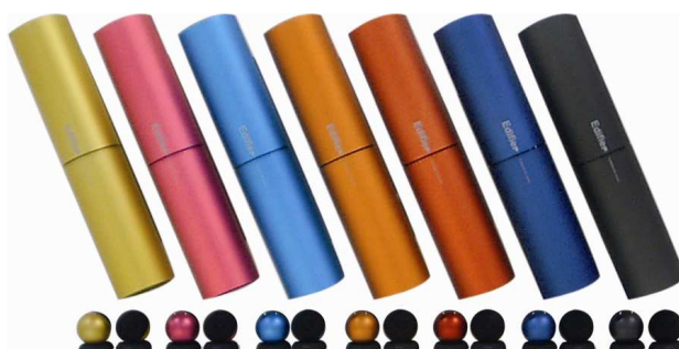
Edifier weckt Frühlingsgefühle auf der CeBIT

Bunt ist auch der neue Farbanstrich des ausgezeichneten und portablen MP300 Plus. Goldgelb, Rosa, Hellblau, Aprikot, Orange, Dunkelblau oder Anthrazit – wer die Wahl hat, hat die Qual.