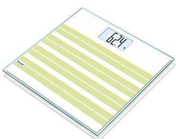
GS20 Summer Seed

Alle Waagen der neuen Kollektionen verfügen über eine besonders große LED-Anzeige, mit einer Ziffernhöhe von 44 mm. Die Tragkraft liegt bei 180 kg, das Gewicht wird dabei in 100 g-Schritten angezeigt. Per Quickstart-Einschalttechnik sind die Schmuckstücke sofort einsatzbereit, die integrierte Abschaltautomatik schont die mitgelieferte Batterie.