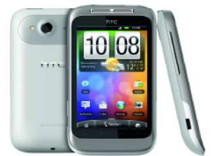
HTC Wildfire S